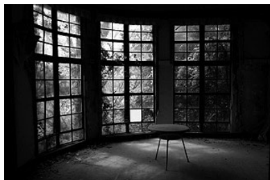
閉鎖の摩耶国際観光ホテル(神戸市)