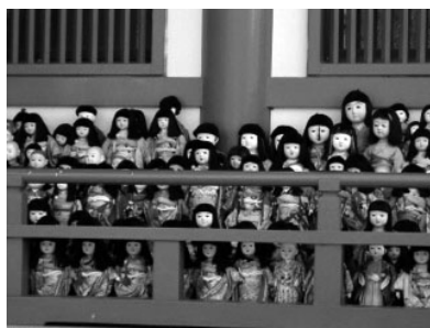
淡嶋神社(和歌山市)